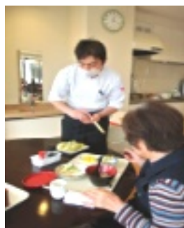
▲揚げたてをどうぞ！！