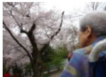
▲満開の桜を見上げる入居者様