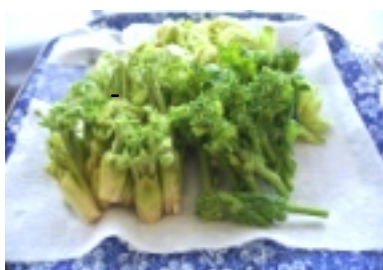
▲たらのめ・菜の花・フキノトウ

毎年恒例、大人気の「山菜の天ぷら」をダイニングで揚げをご用意しました。春の香りいっぱいの天ぷらはいつもお好評頂いています。