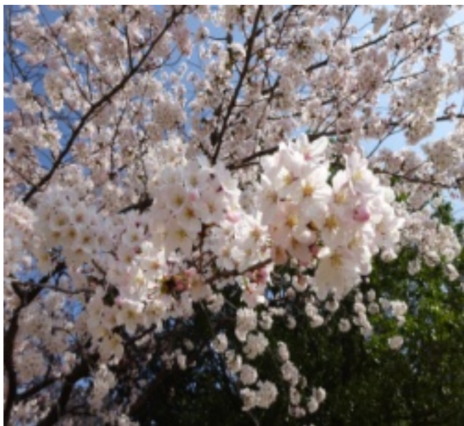
▲桜の花がま〜るく集まり、とてもかわいらしい！！

心待ちにしていた桜の季節がやってまいりました。一番きれいな桜を見た。一番きれいな桜を見て頂きたいので、満開になる頃合いを見計らい、今年には冠稲荷神社にお花見に出掛けました。 満開の桜と記念撮影をしたり、桜を見上げて物思いにふけったり、皆さま ま思い思いにお花見を楽しんでおられました。冠稲荷神社に併設された結婚式場内でアイスクリームなどスイーツが販売されており、花より団子！そちらも楽しんで頂けたようです。一年のうちほんのひとときですが、幸せな時間でした。