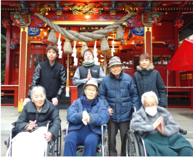
▲拝殿の前にて…。ご利益がありますように！！

一月十四日、二十一日と二日間に分け、太田市細谷町にあります冠稲荷神社へ初詣に行ってきました。 穏やかで暖かい初詣日和！神社の鳥居をくぐり、太田市の重要文化財でもある拝殿を参拝しました。お願いことは様々：私もおたくさんありますが、まずは一年無事に過ごせ たことへの感謝を捧げるようにしています。入居者の皆様も売店でお土産やお守りを買われ、「孫にあげようかしら。」と嬉しそうに話していました。 今年もラッパーズに関わるすべての方々が、平和で幸せな日々を過ごされますようお願いしております。