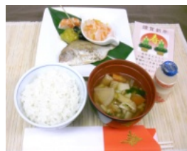
▲お正月気分が上がります。

て、入居者様も「美味しい」と笑顔いっぱいです。その他にも、三日とろろや七草粥など、季節のものをお楽しみいただきました。