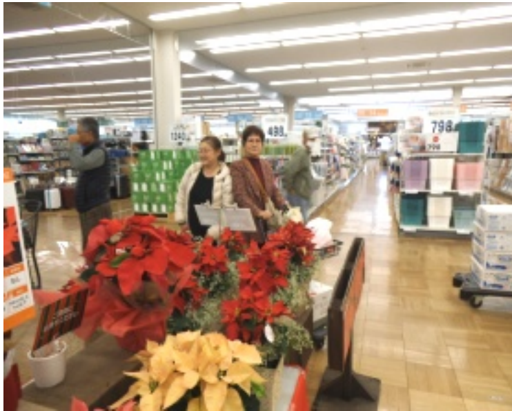
▲ショッピングを楽しむ入居者様