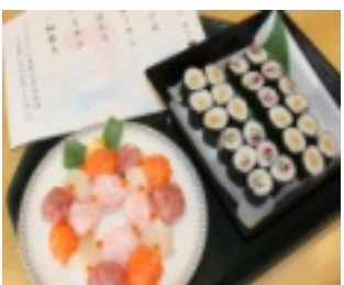
▲きざみ手まり寿司のリース

涼しい時期になり、なまもの提供が解禁となりました。それにとともに、心待ちにしていたお寿司バイキングが行われました。マグロ、ホタテ、