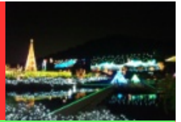
▲栃木県足利市フラワーパークのイルミネーション。幻想的な世界が広がります。

発行：介護付有料老人ホームラッパーズ太田 群馬県太田市高林北町1129-1 電話：0276-55-2525 FAX：0276-38-2751 ホームページ：http://www.rappers-ota.jp