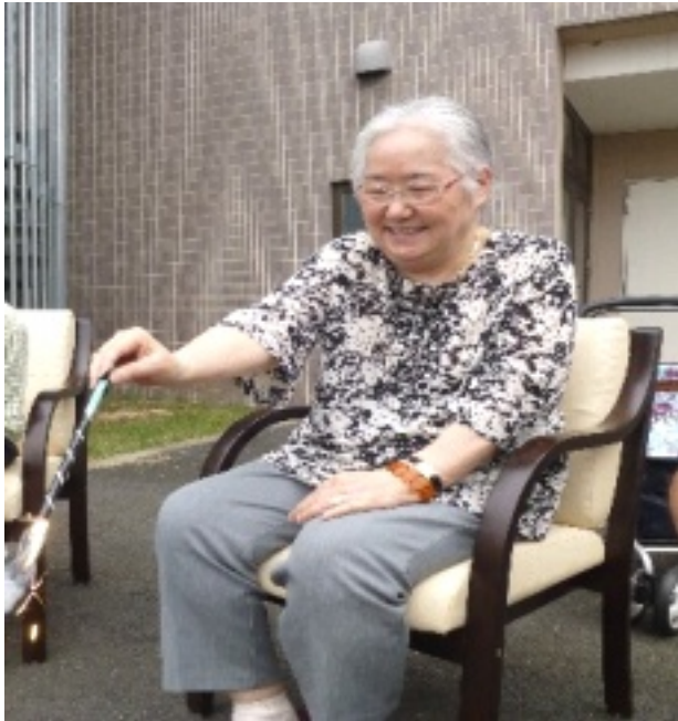
▲花火を楽しむ入居者様

入居者様にも、「今年も出来て良かったよ。やっぱり花火は綺麗だね。」と喜んでいただけました。また来年、さらにパワーアップした納涼花火大会が開催できるように企画していきたいと思えます。お楽しみに！