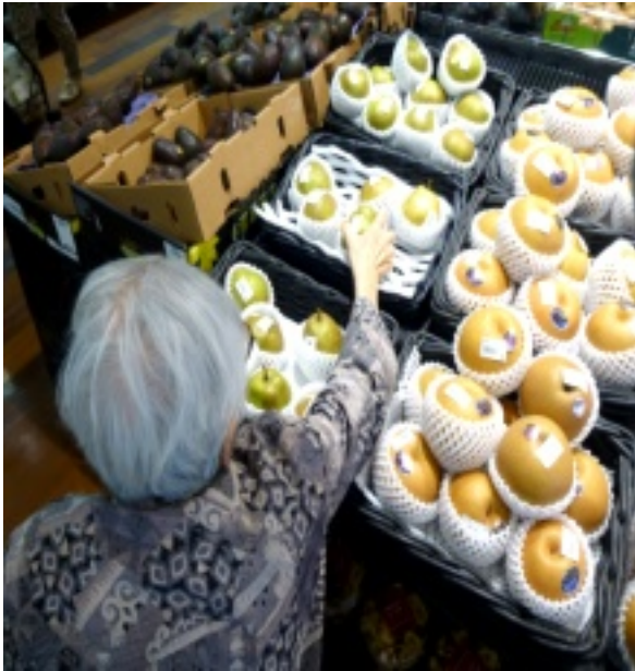
▲商品を選ぶ姿はまさに主婦そのもの

発行：介護付有料老人ホームラッパーズ太田 群馬県太田市高林北町1129-1 電話：0276-55-2525 FAX：0276-38-2751 ホームページ：http://www.rappers-ota.ocn.ne.jp